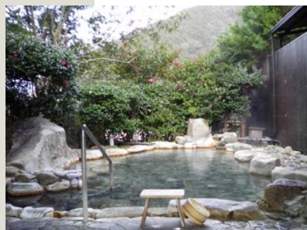
家族専用貸切露天風呂