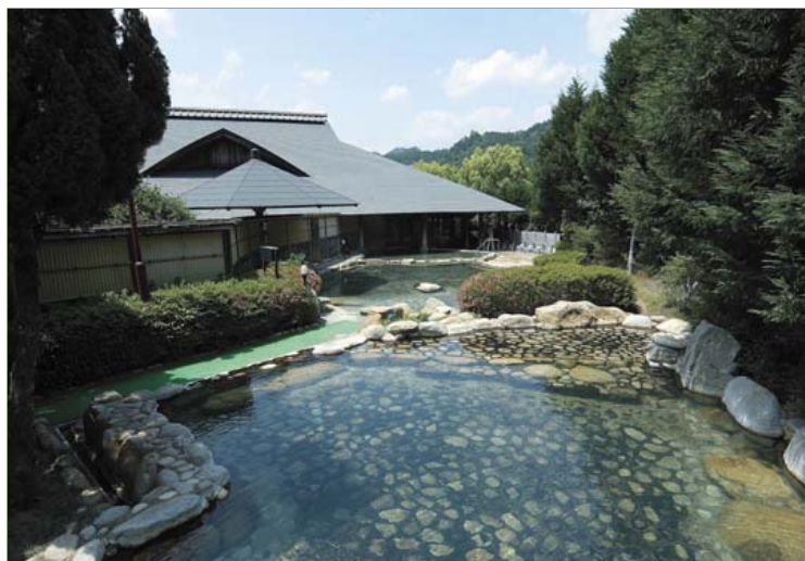
源泉かけ流し大露天風呂